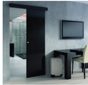
Versione a n. 1 traversa