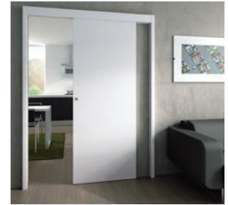
Versione a n. 1 traversa + n. 2 montanti

AppliSystem è la soluzione che permette di risparmiare spazio facendo scorrere le porte esternamente alla parete, senza nessuna opera muraria.